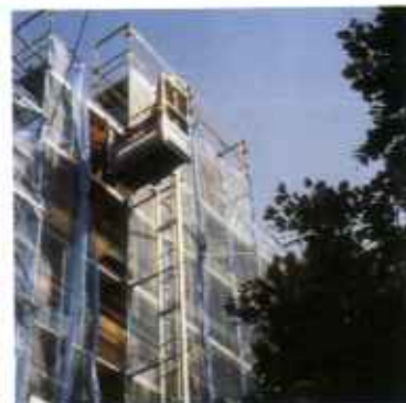
Fogasléces ferdepályás és függőleges felvonók