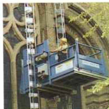
Személy-terher szállító felvonók