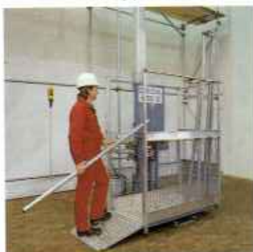
Fogasléces felvonók alumínium oszloppal