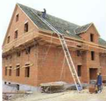
Ferdepályás köteles felvonók