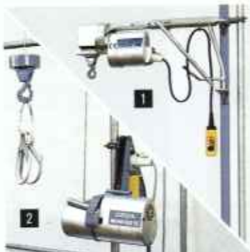
Köteles felvonók: ■ Csőrőfelvonó ■ Állványépítő felvonó