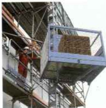
Fogasléces felvonók acél oszloppal